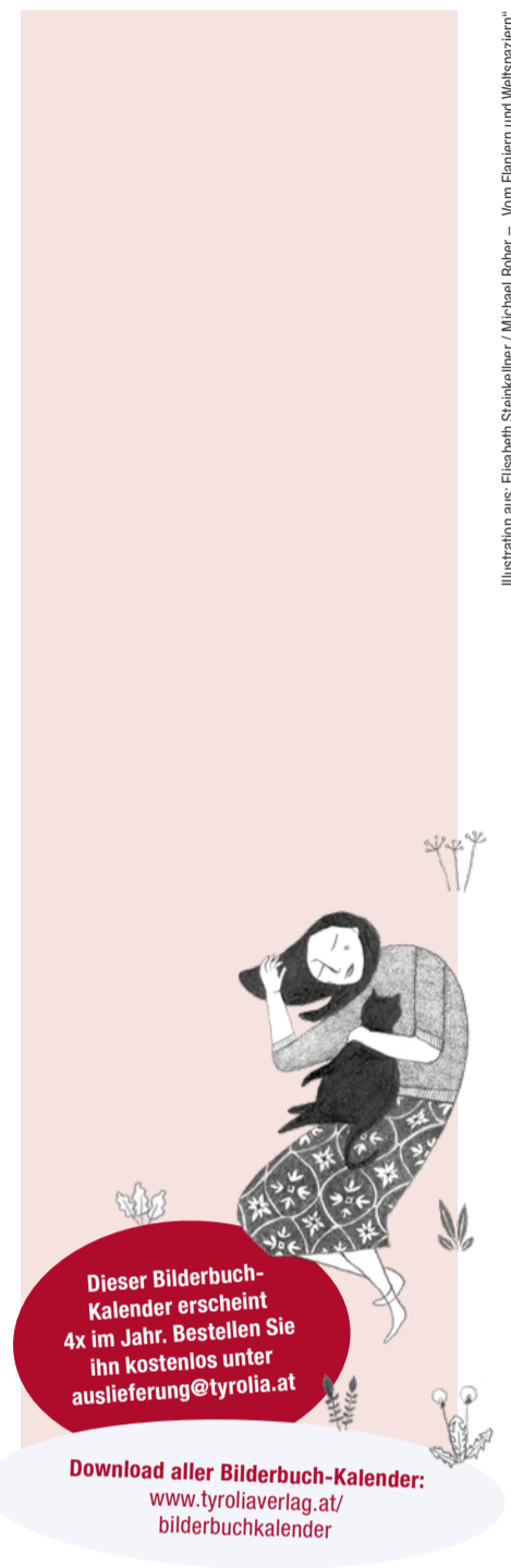
Illustration aus: Elisabeth Steinkeller / Michael Rohrer - „Vom Flanieren und Weitspacieren“