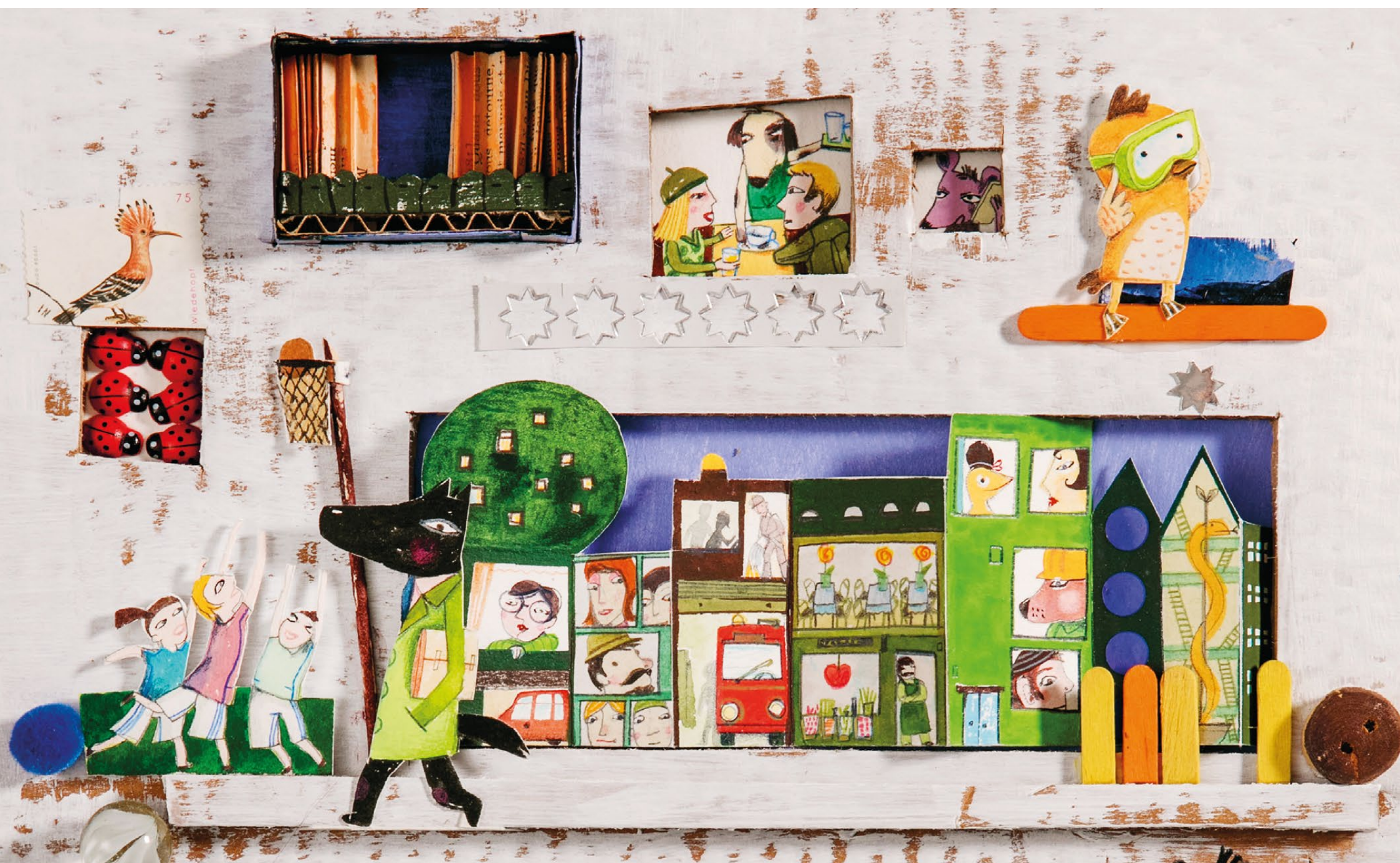
Illustration aus: Renate Habinger – „Nicht schon wieder stöhnt das Gubenpony und macht sich auf den Weg“

Download aller Bilderbuch-Kalender: www.tyroliaverlag.at/bilderbuchkalender