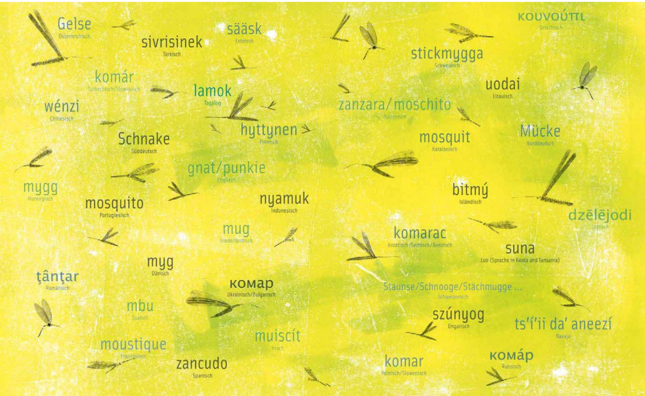
15. August: Mariä Himmelfahrt

Dieser Bilderbuch-Kalender erscheint 4x im Jahr. Bestellen Sie ihn kostenlos unter auslieferung@tyrolia.at