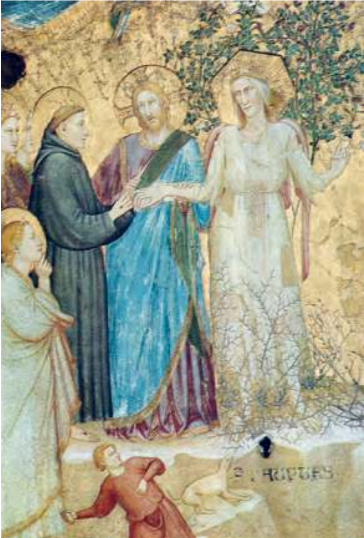
Fresko aus der Giotto-Schule (ev. Parente di Giotto) um 1315–20 in der Vierungskuppel der Unterkirche San Francesco in Assisi: Christus gibt Franziskus und die Herrin Armut als Brautpaar zusammen.