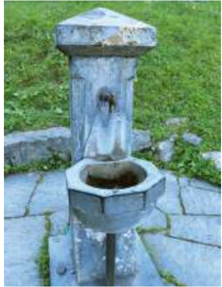
Der Brunnen vor der Ulrichskapelle spendet das beliebte Wasser der Ulrichsquelle.

verblassten Zustandes eine eindrucksvolle Wirkung entfalten. Pilger haben über die Jahrhunderte hinweg an die Kirchenwände ihre Kürzel gemalt – ein Beweis für die Anziehungskraft dieses Ortes bis heute. Auf dem neugotischen Altar sehen wir den Kirchenpatron zwischen den Heiligen Ottilia und Barbara. Der moderne Brunnen vor der Kirche spendet das beliebte (Heil-)Wasser der Ulrichsquelle.