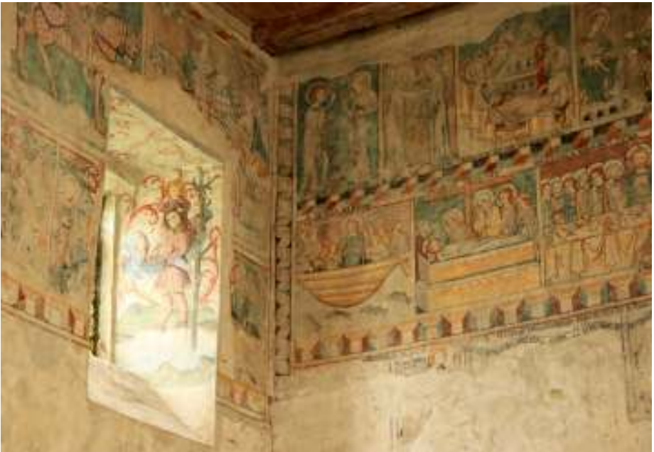
Die mittelalterlichen Fresken in der Martinskapelle bilden quasi eine Armenbibel.

Wir können nun geradeaus die Bergmannstraße hinunterspazieren und an ihrem Ende nach links in die Anton-Schneider-Straße einbiegen. Wieder wandern wir direkt auf ein Gotteshaus zu, die sogenannte Seekapelle.