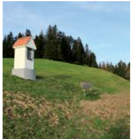
Nach dem Bildstock geht es endlich flacher dahin – und wieder in ein schönes Waldstück.