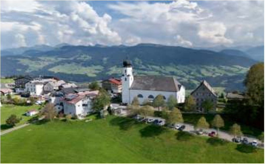
Auf der Anhöhe bewundern wir das einmalige Ensemble von Marienlinde, Pfarrhaus und Kirche von Sulzberg.

Wir halten uns weiter an die schmale Straße und erreichen etwa 400 Meter weiter die kunstgeschichtlich bedeutendere der beiden Kapellen, die Leonhardskapelle.