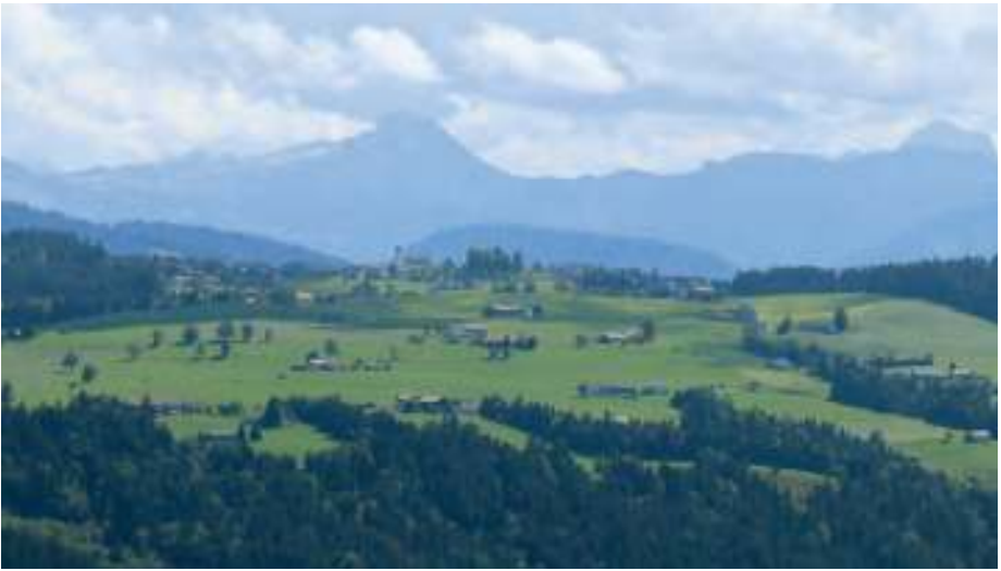
In der anderen Richtung liegt Sulzberg (Tour 3) vor den Vorarlberger Bergen.

» St. Anna, die größte und älteste Kapelle Scheideggs, wurde bereits um 1500 erbaut. Ihre Beliebtheit bei beiden Konfessionen rührt daher, dass nach dem Zweiten Weltkrieg vor der Erbauung der evangelischen Kirche hier die protestantischen Gottesdienste abgehalten wurden. Auf dem Hauptaltar können wir eine schöne Anna-Selbdritt-Gruppe bewundern.