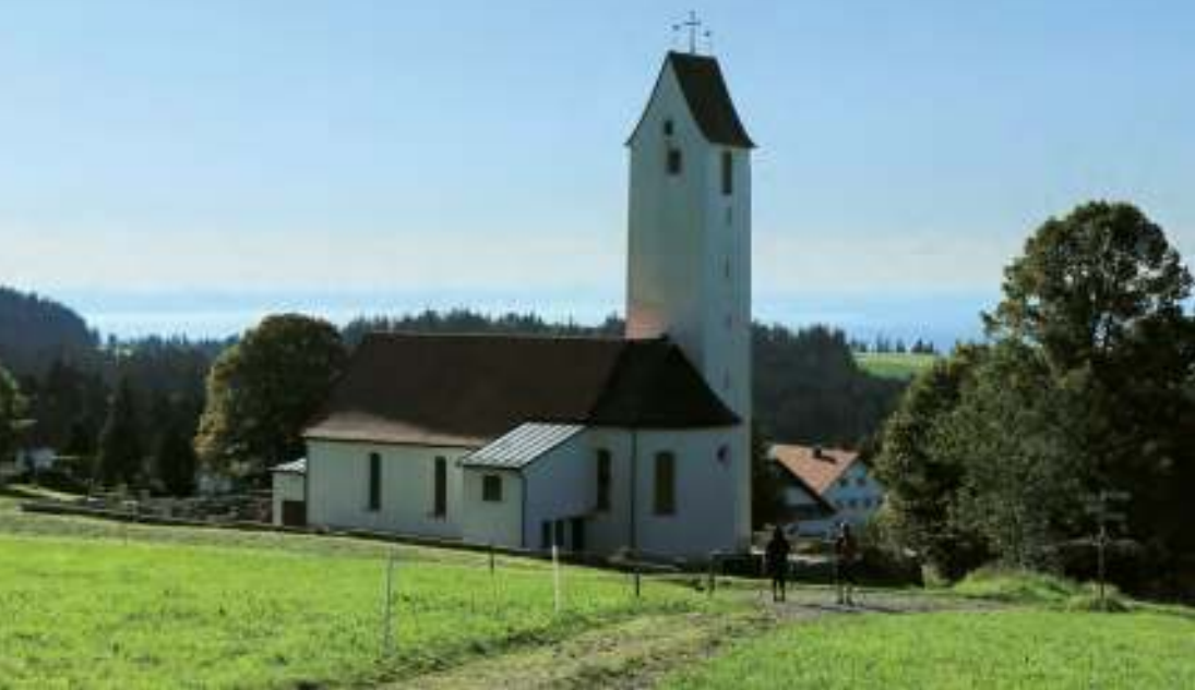
Die Pfarrkirche St. Ulrich vor dem grandiosen Bodensee-Panorama.

halten und dort auf einem Forstweg bis zu einer gerade über die Felder verlaufenden Trasse weiter aufsteigen. In jedem Fall erreicht man nach der Querung der Wiesen die Häuser von Möggers und die Straße, auf der wir weiter bergauf zur Kirche wandern. Die letzten Höhenmeter werden mit Treppen überwunden, dann stehen wir schon vor der Pfarrkirche St. Ulrich.