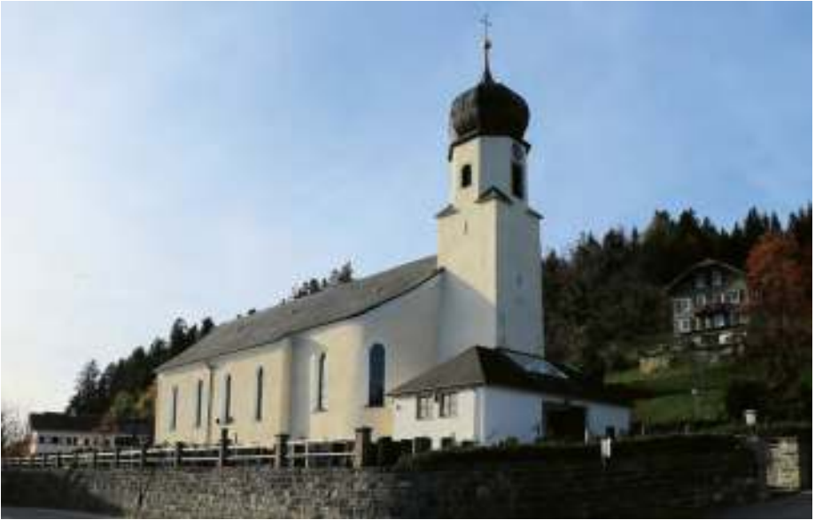
Die Pfarrkirche von Doren ist dem hl. Johannes Nepomuk geweiht.

kleine Straße, die in unserer Gehrichtung weiter- und aus dem Wald hinausführt. Bei einem stattlichen Hof treffen wir erneut auf eine Straße, an der es für beson-