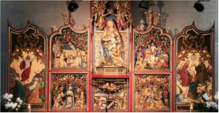
Der Gnadentalter aus dem Jahr 1500 in der Klosterkirche Mehrerau.

» Bereits außen fällt die riesige Portalplastik aus Betonguss ins Auge, die 1962 errichtet wurde. So ist man bereits darauf vorbereitet, dass wir uns auf den Fundamenten der romanischen Basilika von 1125 befinden, von der allerdings nichts mehr erhalten ist, da sie bzw. auch der ihr nachfolgende Barockbau nach der Aufhebung des Benediktinerklosters 1808 abgerissen wurde. Auch im Inneren der von 1961 bis 1964 erbauten neuromanischen Kirche herrscht Beton vor und gibt dem Ort eine nüchterne Atmosphäre. Die fast schon brutale Schlichtheit wird in den Kapellen durch etliche wertvolle Skulpturen und Gemälde verschiedener Zeiten aufgebrochen – vor allem der Gnadentalter aus dem Jahr 1500 gleich beim Eingang schafft eine Verbindung zur früheren Bedeutung dieses Ortes.