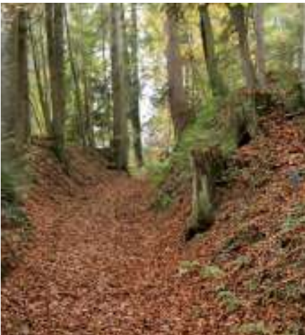
Unser Weg führt uns zunächst als schmaler Pfad in den Wald hinein.

ders Interessierte nach links zur Heiligkreuzkapelle geht – der Abstecher lohnt aber nur bedingt. Wir orientieren uns also nach Sulzberg und halten uns rechts. Das