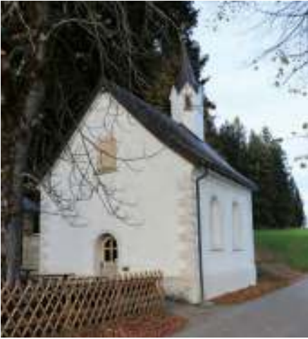
Zur im 18. Jahrhundert errichteten Falzkapelle führt uns dann eine Straße.

Unser Feldweg stößt auf eine kleine Straße, von der wir aber bald links abbiegen, um an einem Bildstock vorbei zu einer