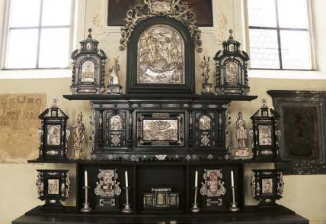
Der berühmte Silberaltar im linken Querarm der Galluskirche.

Wir verlassen den Kirchplatz über die Ernst-Volkman-Stiege hinunter zum Kloster Thalbach. Der Name ehrt den früheren Mesner von St. Gallus, der als Kriegsdienstverweigerer und Widerstandskämpfer im Zweiten Weltkrieg hingerichtet wurde. Unten angekommen lohnt sich ein Abstecher nach rechts zur Kirche des Klosters, in der ewige Anbetung gehalten wird. Daher ist eine Besichtigung nur im Rahmen eines persönlichen Gebetes möglich.