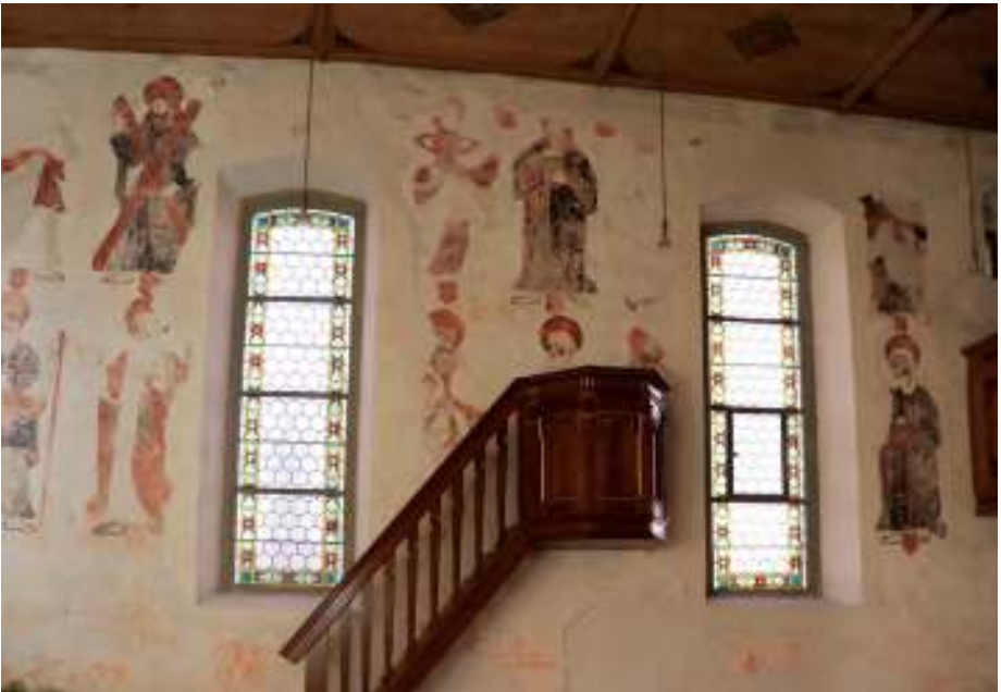
Die spätgotischen Fresken in der Leonhardskapelle.

» Ein eingezäunter Vorplatz mit einer Lourdesgrotte lädt schon von außen zu einer (geistlichen) Rast ein – in der Weihnachtszeit schmückt sogar eine Krippe die künstliche Felslandschaft. Die Kapelle selbst, die 1750 anstelle eines alten Holzbaus errichtet wurde, besitzt einen schönen Barockaltar mit einer Statue des Schmerzensmannes aus dem Erbauungsjahr.