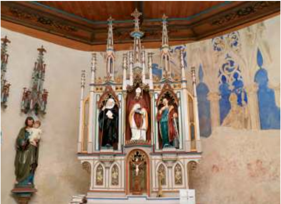
In der Apsis der Ulrichskapelle finden wir sogar gotische Fresken.

Auf dieser Seite der Kapelle führt nun ein Weg bergab und überquert bald die grüne Grenze nach Bayern. An den Wegweisern wandern wir geradeaus vorbei und am Rand einer malerischen Schlucht abwärts, bis wir zu einem Wanderparkplatz kommen. Auf der schmalen Straße geht es nach links, und in leichtem Bergauf und Bergab erreichen wir eine malerisch gelegene Kapelle in Ebenschwand.