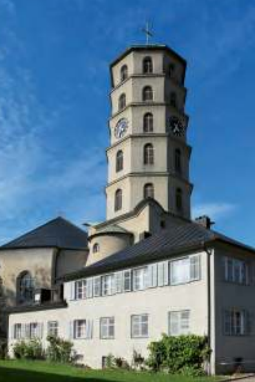
Die Bregenzer Mariahilfkirche mit ihrem markanten Turm.

Gegenüber der Kirche führt uns die Friedhofgasse wieder ins Grüne und in den Mariahilfpark. Wir wandern an der Friedhofsmauer den Sandgrubenweg entlang, der am Ende des Friedhofs einen Knick nach links macht, den wir mitvollziehen. Nach etwa 200 Metern biegen wir nach rechts in den alten Tunnel der Bregenzerwaldbahn ab, der uns leicht ansteigend weiterführt. Wir kommen an einer Wiese mit einem wunderbaren Ausblick auf den Gebhardsberg wieder ins Freie. Nun biegen wir nach links auf die Gletscherstraße ab und halten uns über die Sonnenstraße hinweg geradeaus auf dem Fußgängerweg, der uns auf die Josef-Huter-Straße bringt, der wir nach rechts folgen. An der Kreuzung mit der Gallusstraße biegen wir links in diese