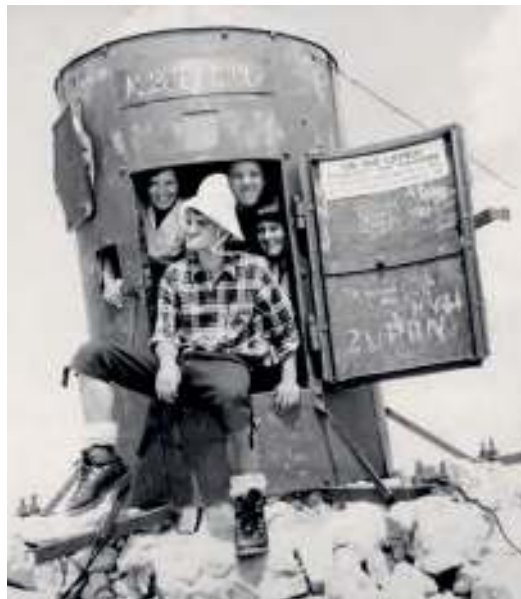
Turm des Anstoßes: der Aljažev stolp anno 1968, gezeichnet von jahrzehntelanger politischer Propaganda und simplem Vandalismus. 2018 wurde er im Tal gründlich restauriert und wieder am Gipfel des Triglav aufgestellt.

In den Dokumenten werden die Bemühungen des SPD um den Erwerb des Sektionsarchivs erwähnt. Es ist nicht klar, wann und wie dieses zunächst nach Graz verlegt wurde – vermutlich von Rizzi, der es dann auch 1941 auf Anfrage des DAV nach Innsbruck schickte. Nachdem das Archiv der Sektion Krain dort zugänglich ist, können wir heute einige der losen Enden in der Geschichte des nationalen Kampfs in Krain zusammenbinden – Rizzis Entrüstung gehört dazu: