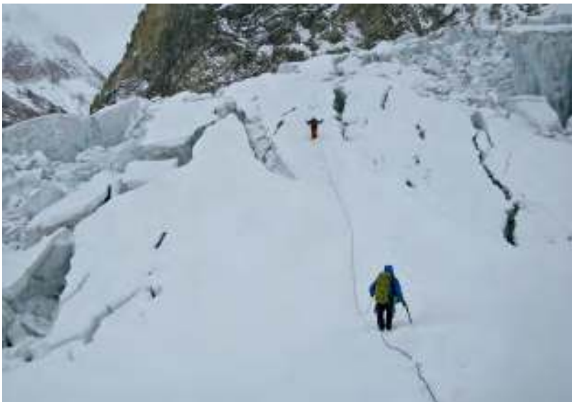
Gletscherspalten, Lawinen, Kälte: Auf der Winterexpedition zum Gasherbrum II.