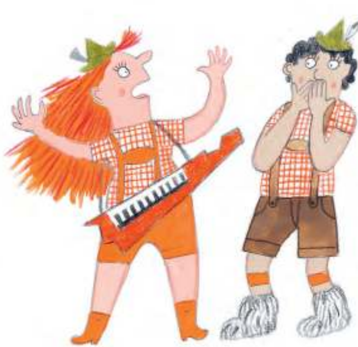
ROSI, DIE BERGSTRAWANZERIN