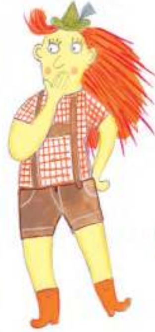
SUSI, DIE GEBIRGSRCKERIN