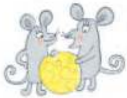
FLORI UND FIPS