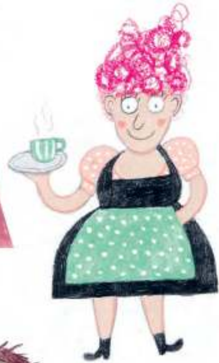
GUNDI, DIE HÜTTENWIRTIN