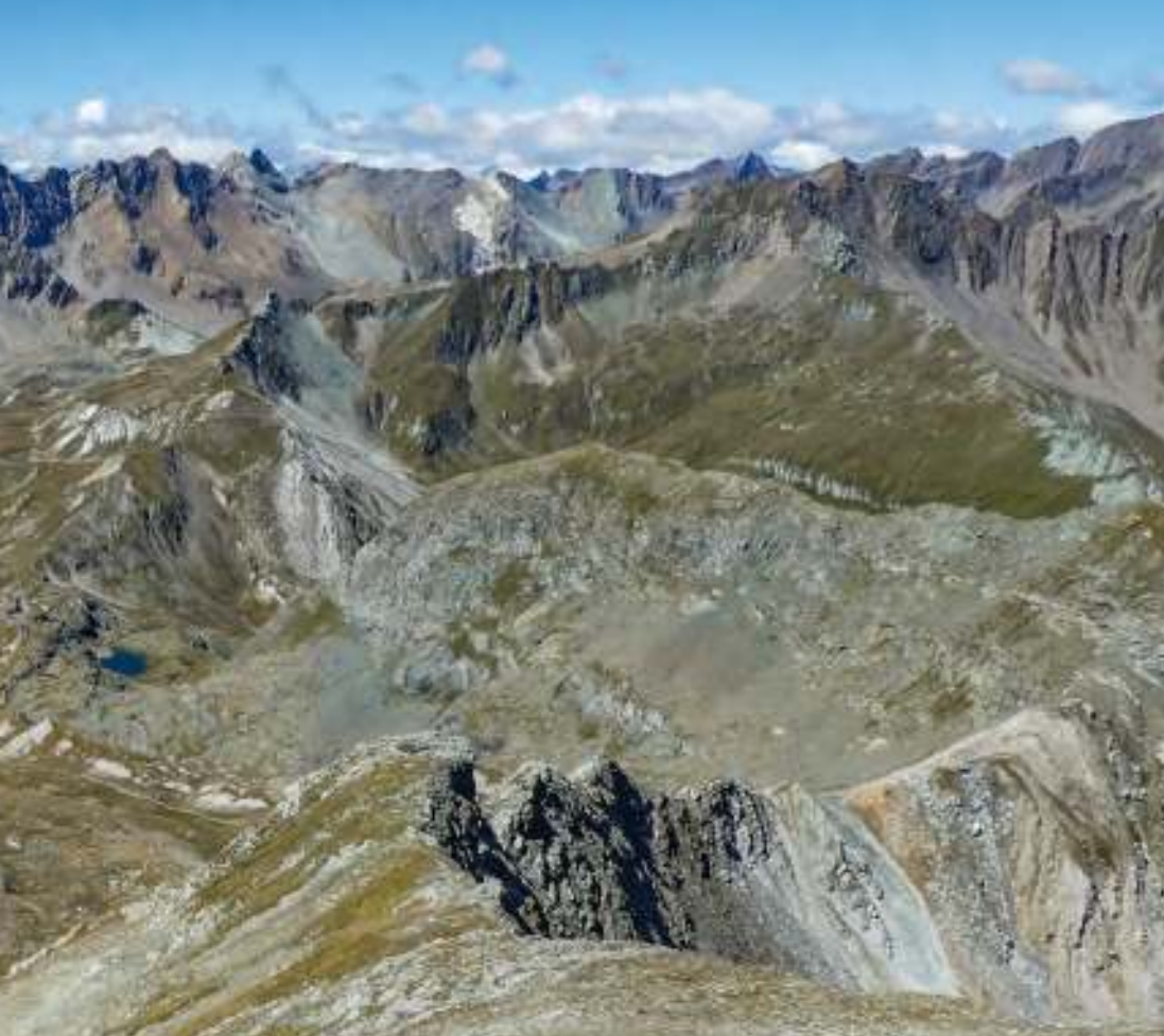
Traumhafter Ausblick auf das Gipfelensemble rund um die Neue Reichenberger Hütte.

baltals, im Osten. Die „Schwachstelle“ bildet die Südabdachung. Dort reichen Hochkare bis fast an die Gratlinie heran und lassen Gipfelbesteigungen auf verschiedene Dreitausender zu.