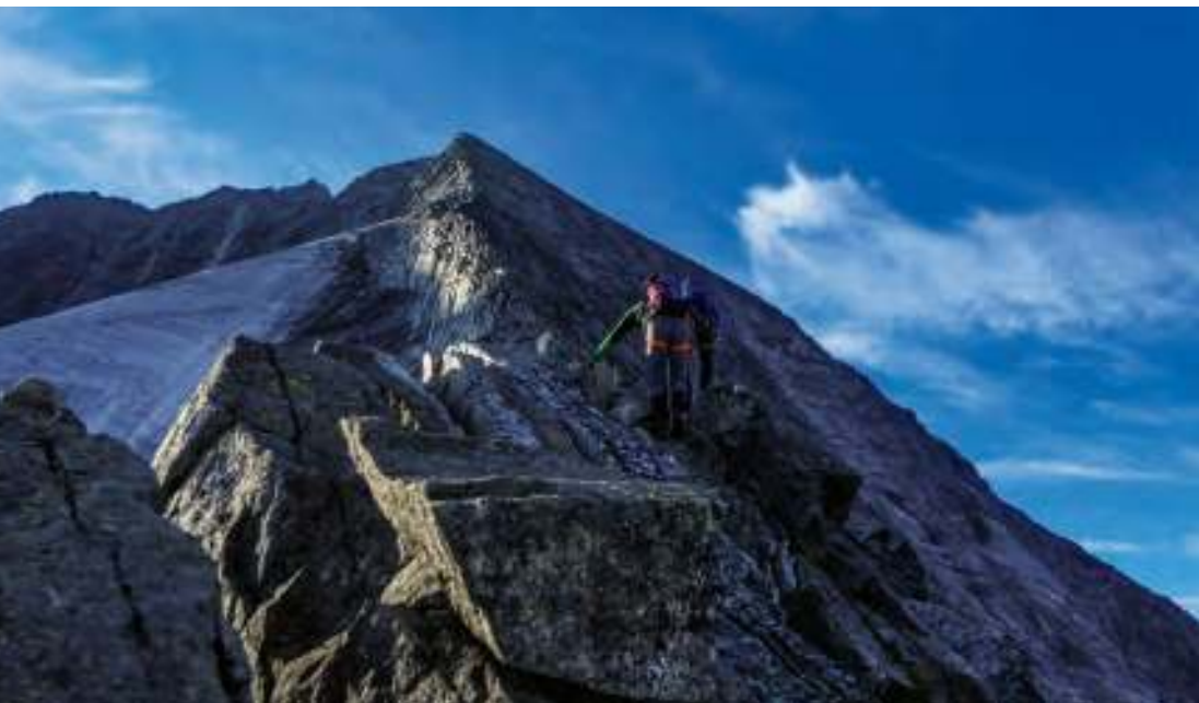
Bergsteiger nach dem Grauen Nöckl am Weg zum Hochgall (Südtiroler Anstieg).

Alle in diesem Buch angeführten Berge liegen im Nationalpark Hohe Tauern. Bei einigen Touren befindet sich auf halbem Weg eine Schutzhütte, so dass die Besteigung als Zweitagestour geplant werden kann. In diesen Fällen wurden Gehzeit und Wegstrecke entsprechend aufgeschlüsselt. Wo es sinnvoll und nötig ist, werden Hinweise zu besonders zu beachtenden Gefahren und zur benötigten Ausrüstung gegeben.