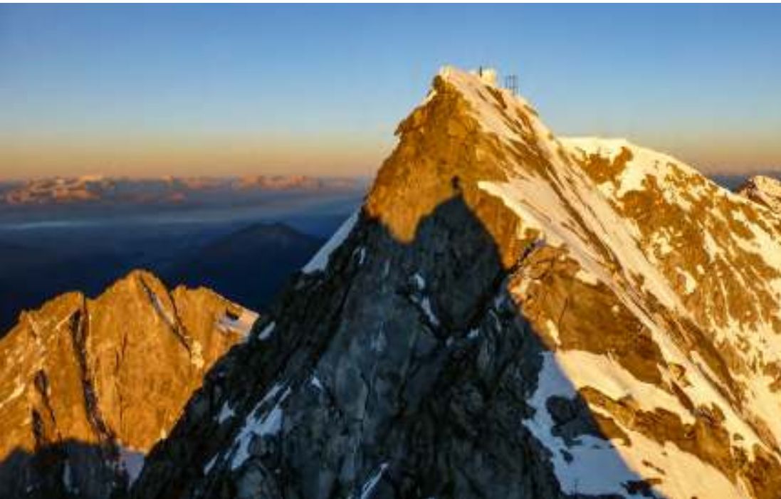
Sonnenaufgang bei einer Hochgallbesteigung Ende Juni, wo die Hochgallrinne noch gut mit Schnee gefüllt war.

Kein Berg in Osttirol ist vom Klimawandel dermaßen betroffen wie der Hochgall. So hat der Rückgang der Gletscher und das damit verbundene Abtauen von Eis und Schnee die berühmte Hochgallrinne bis auf den mürben Fels freigelegt und diesen einst klassischen Anstieg in eine gefährliche Steinschlagzone verwandelt. Das gilt übrigens auch für die gesamte Südost- und Nordseite des Berges. Durch die Hochgallrinne verlief in der Regel der Normalweg von Osttiroler Seite, über die Barmer Hütte kommend.