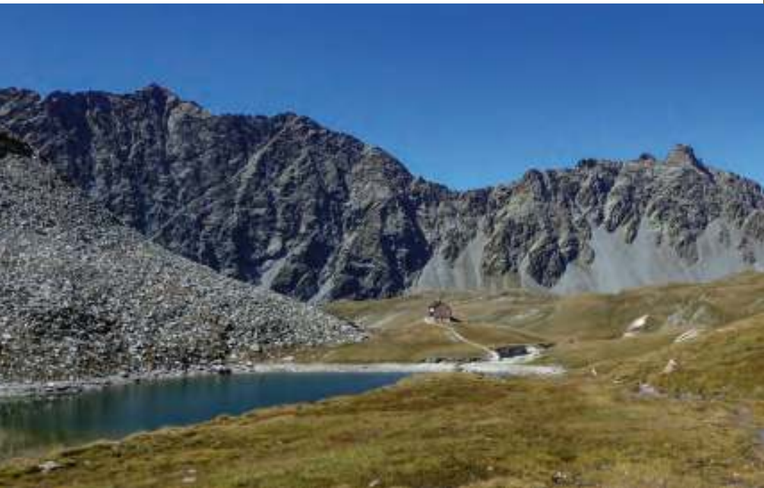
Im Bereich der Reichenberger Hütte. Im Hintergrund Alpesspitze und Keeseck.

Anfahrt: Von Lienz oder Matrei auf der B 108 (Felbertauernstraße) bis Huben. Dort ins Defereggental (L 25) abbiegen und taleinwärts nach St. Jakob in Deferegggen fahren.