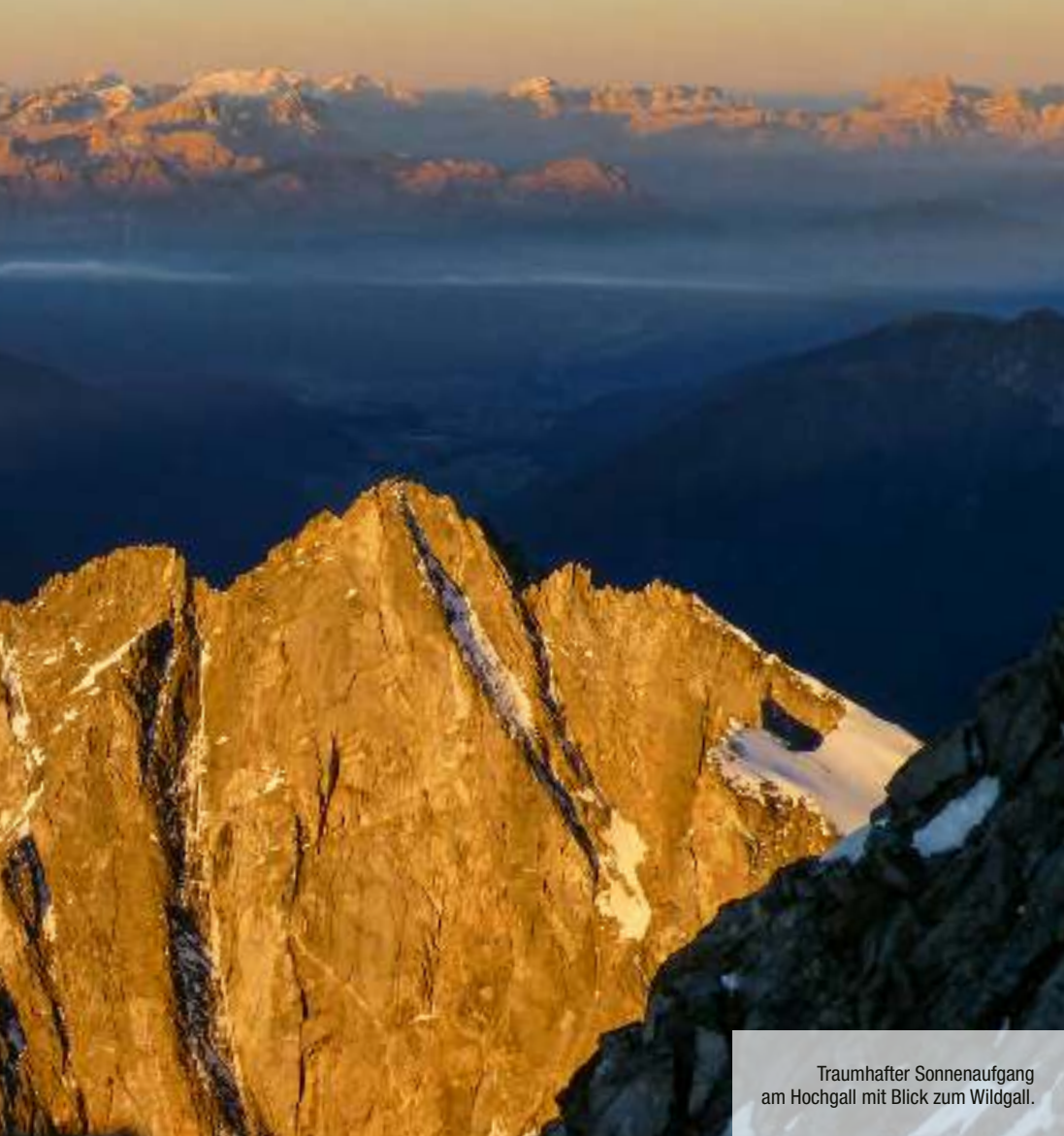
Traumhafter Sonnenaufgang am Hochgall mit Blick zum Wildgall.

Glanz längst verloren, das Eis ist komplett weggeschmolzen und eine Besteigung des Hochgalls durch diese Rinne ist mittlerweile nur mehr im Frühsommer bei ausreichender Schneelage anzuraten. Das Gleiche gilt für die Nordwand. Früher eine reine Eiswand, ist sie mittlerweile zu einer brüchigen Felstafel verkommen, die nur mehr im Winter began-