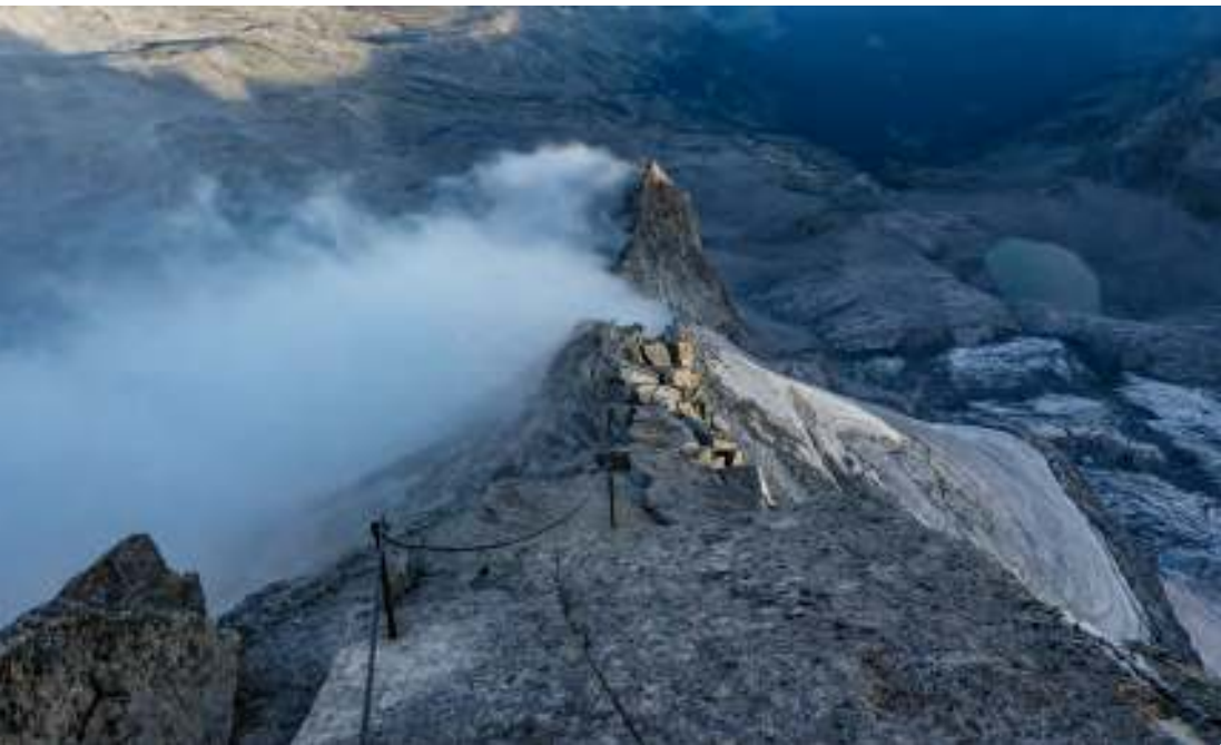
Eine traumhafte Gratlinie zieht vom Grauen Nöckl Richtung Hochgall.

langgezogene Schutthalden im Moränengelände nach Südosten zum Fuß des Nordwestgrats mit dem dreieckigen Gipfel des Grauen Nöckls (3084 m) aufzusteigen. Der als Mittlerer Rieserferner bezeichnete Gletscher hat sich mittlerweile so weit zurückgezogen, dass es beim Aufstieg nirgendwo mehr zu Eiskontakt kommt. Man marschier im Rechtsbogen in das Kar zwischen Hochgall und Wildgall und peilt so das Graue Nöckl von der Rückseite (Süd) über einen breiten Gratrücken an, der bei ca. 2700 m betreten wird. Über den blockigen Westgrat zum Gipfel. Jenseits muss ausgesetzt in eine klaffende Scharte bis ca. 3000 m abgeklettert werden (II). Über die steilste Stelle hilft ein Stahlseil.