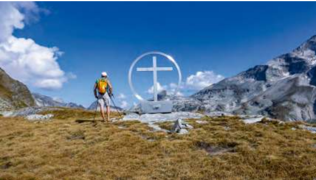
Am Spinevitrolkopf mit Blick zum Kaiser Tauern und Kastengrat (rechts).