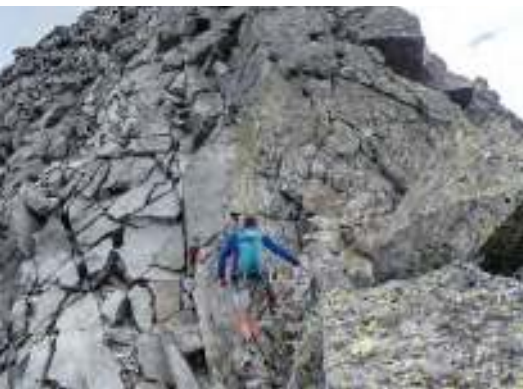
Am Beginn der Schlüsselstelle, die mit einer aalglatten Eisenkette etwas entschärft ist. Armkraft sollte aber trotzdem vorhanden sein.

Vom Parkplatz über eine Brücke und rechts am Gasthof Patscher Hütte vorbei zu einer ersten schmucken Almhütte. Man folgt nun dem Güterweg nach Westen bis zu seinem Ende beim Aufzugshüttl der zur Barmer Hütte führenden Seilbahn (1992 m). Weiter über den parallel zum Bach verlaufenden Schuttsteig in weiten Kehren bergwärts. Unterhalb der Reste der Alten Barmer Hütte (2520 m) sind ein paar mit Stahlseilen entschärfte Passagen über eine Art Felsrippe zu