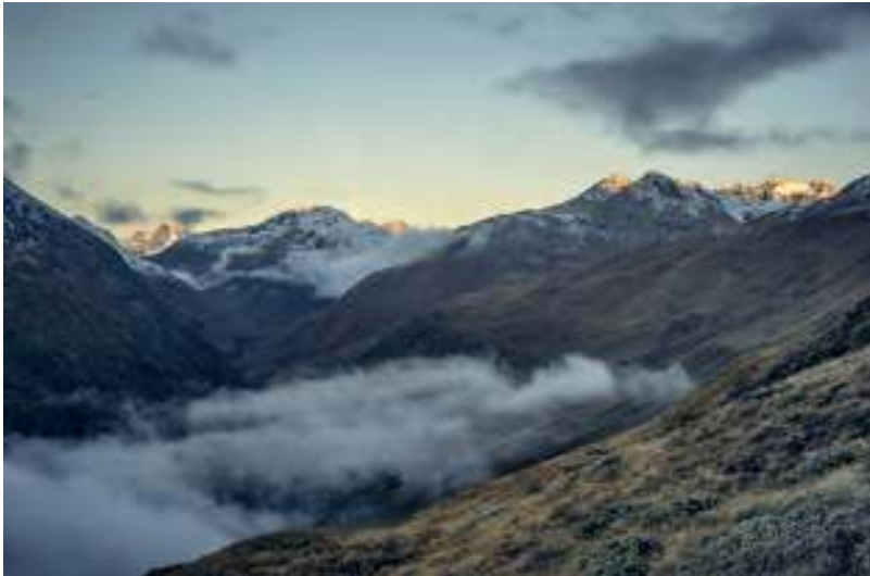
Die Rofenhöfe (unten) vermitteln den Zugang ins großartige Rofental.