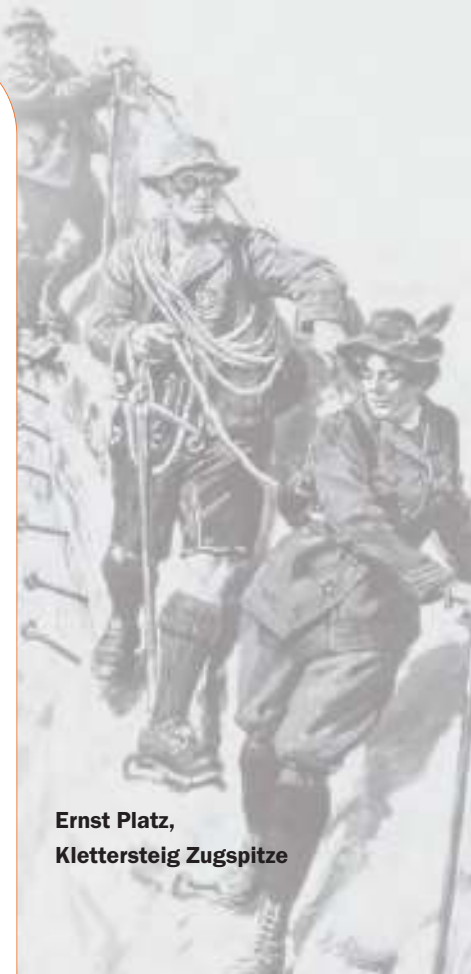
Ernst Platz, Klettersteig Zugspitze

■ 1843 wurden zur Erleichterung des Anstiegs auf den Hohen Dachstein erste solide Sicherungen angebracht, 1878 wurde am Dachstein das „Mecklenburgband“ mit 133 kg Eisen und 500 m Schiffstau gesichert.