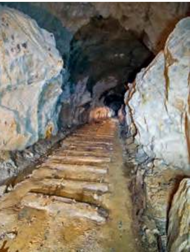
Stollen im Ötztal: Planten die Nazis eine „Alpenfestung“?

Aber nichts läuft mehr richtig zusammen in diesen letzten Kriegstagen. Amerikanische Truppen stoßen in Österreich auf den Fernpass und in Deutschland auf Garmisch-Partenkirchen vor. Die Befehle bei der Wehrmacht und der SS, in den Lagerkommandanturen und Parteileitungen gehen wirt durcheinander. Ein Zug mit 1700 Gefangenen bleibt am 28. April in Seefeld stecken, die Weiterfahrt nach Innsbruck ist nicht mehr