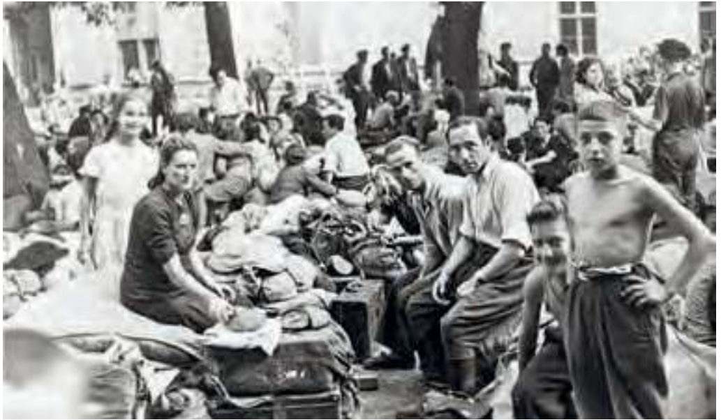
Die ganze Habe im Koffer: Jüdische Flüchtlinge aus Polen warten auf den Weitertransport.

überstanden die Ghettos in Warschau, Lemberg, Litzmannstadt, aus denen üblicherweise die Wege in die Gaskammern führten. Sie haben oft ihre ganze Familie, fast immer ihren ganzen Besitz und manchmal auch den Verstand verloren. Von nun an gelten sie im englischen Wortschatz der Siegermächte als Displaced Persons , „vertriebene Personen“ – Menschen, die im Ursinn des englischen Wortes von ihrem Platz verdrängt wurden.