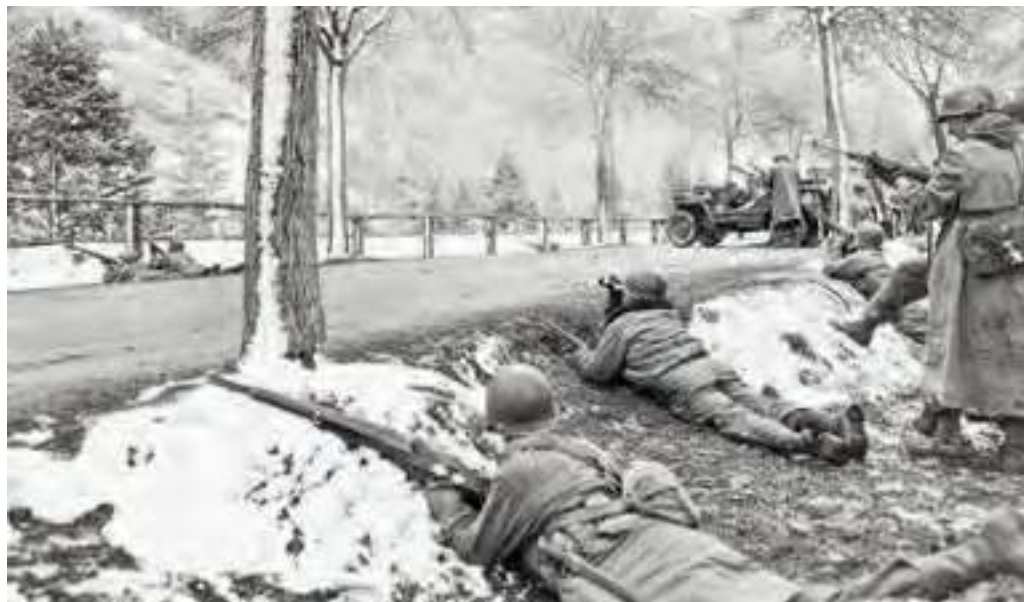
Vormarsch in den Bergen: US-Soldaten bei Scharnitz.

Partenkirchen von US-Truppen kampflos besetzt. Was wird passieren, wenn die Amerikaner in Mittenwald eintreffen? Ist das die Rettung – oder werden die Gefangenen diesen Moment nicht mehr erleben?