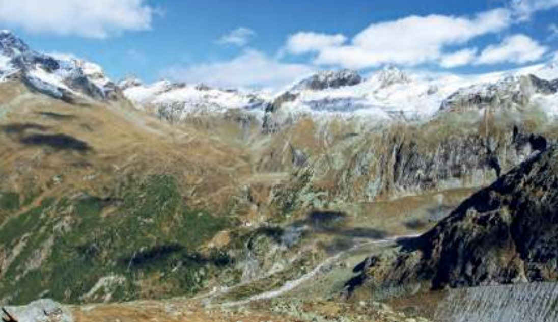
Abstieg vom Schönbichler Horn. Unterhalb der Bildmitte lässt sich die Berliner Hütte ausmachen.