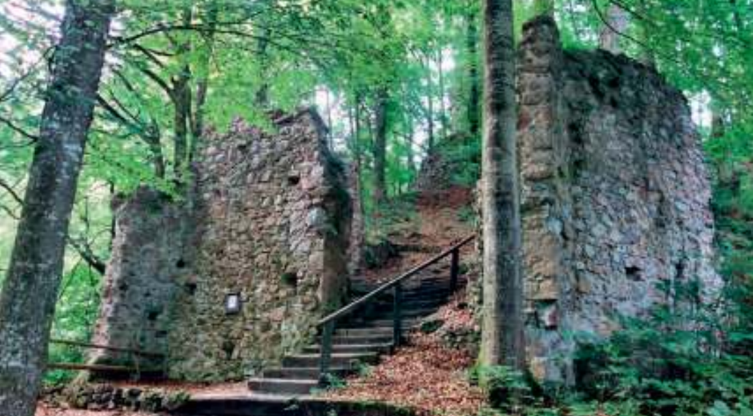
Das Areal der Ruine Rottenburg

Gasthof Esterhammer vorbei am Vieh-Versteigerungsareal durch Wohngebiet. Am oberen Siedlungsrand befindet sich eine Straßengabelung mit der Bezeichnung Rafflhöfe/Brettfall und Rottenburg. Hier rechts Richtung Rottenburg der Straße folgen. Ein breiter Schotter- bzw. Wanderweg, der auch als Bibelweg bezeichnet ist, führt uns hinauf zur Rottenburg. Nach kurzem Wegverlauf kommen wir zur Besinnungstiege , einer mit Skulpturen besetzten Treppe, die im Zeichen des Glaubens errichtet wurde. Unmittelbar nach der Stiege befindet sich das Naturdenkmal Notburgafichte . Diese Fichte ist ca. 200 Jahre alt und 55 m hoch und damit der größte Baum Tirols. Das Holz der Fichte würde drei Lkw-Züge füllen. Im oberen Bereich des Weges lassen sich bereits die ersten Überreste der Rottenburg erkennen. Oben angelangt, führt uns der Bibelweg durch einen steinernen