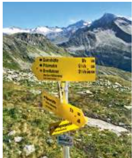
Am Berliner Höhenweg beim Friesenberghaus

Bei der Schreibweise von Namen und bei Höhenangaben haben wir uns an der amtlichen topographischen Karte von Österreich orientiert. Abweichungen zu gebräuchlichen lokalen Schreibweisen auf Hinweisschildern oder in touristischen Kartenwerken kommen in seltenen Fällen vor, sie sind geringfügig und die Bezeichnung stets zu erkennen (z. B. Langer See = Langen See).