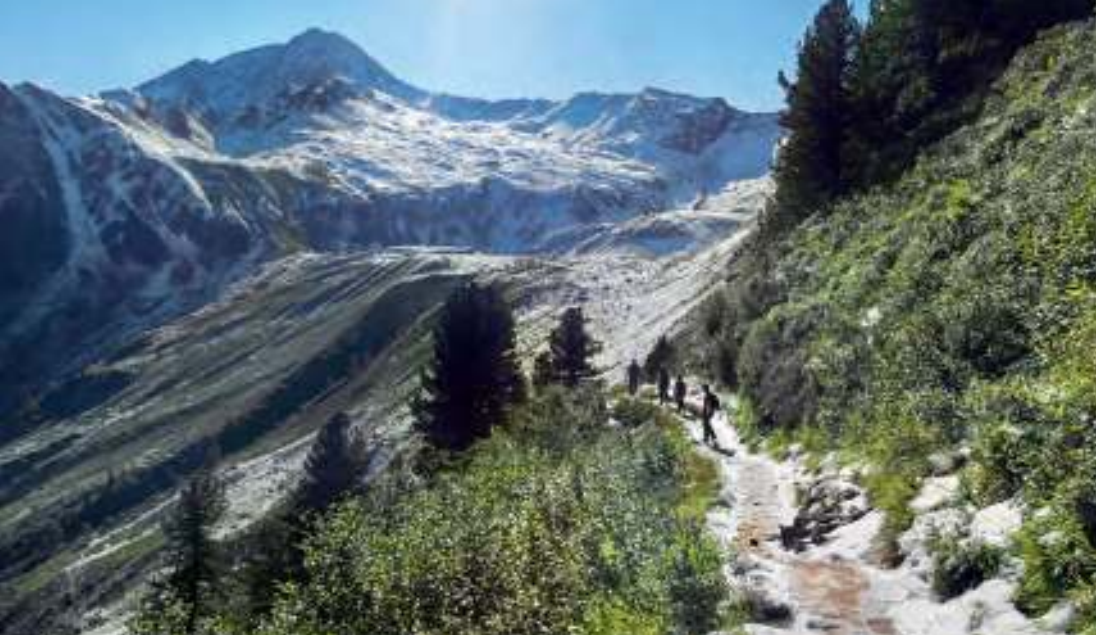
Der Weg zur Ahornspitze nach einem nächtlichen Schneefall Ende August