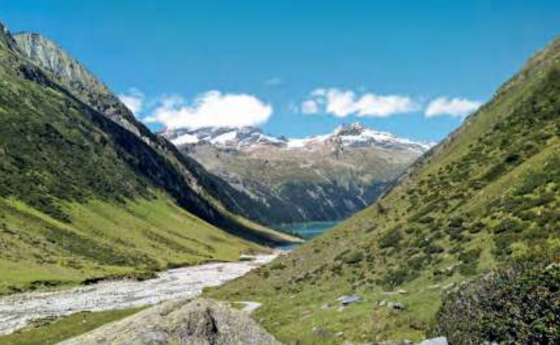
An der Stauwurzel des Schlegeis-Stausees. Über dem See ist der Gipfel der Gefrorenen Wand zu sehen, links davon steckt der Olperer in den Wolken.

grund und über das Hundskehljoch ins Ahrntal, wobei uns nicht bekannt ist, ob daraus jemals zur Gänze oder auch in Teilen ein konkretes Projekt wurde und wer es finanziert haben könnte.