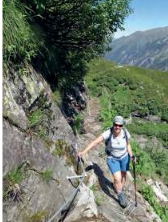
In der Eisenklamm hoch über dem Talschluss des Stilleppgrundes

Antwort: 3 Mal pro Minute (= alle 20 Sek.) ein Zeichen geben, dann eine Minute Pause. Die Zeichen können hörbare Signale (lautes Rufen, Pfeifen) oder sichtba-