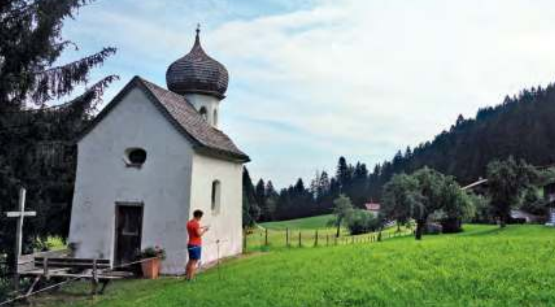
Die Rafflkapelle mit den Rafflhöfen im Hintergrund

tierten Straße erhöhte Aufmerksamkeit. Wählt man diese Variante, so biegt man direkt in der ersten langgezogenen Linkskurve der Forststraße nach rechts in einen schmalen Karrenweg ab (siehe Foto). Dieser führt uns anschließend auf einen angenehm begehbaren Fußweg direkt am Waldrand entlang in Richtung Westen. Rechter Hand haben wir noch einmal einen schönen Blick zurück auf die Rafflhöfen und die Kapelle. Diesem Steig folgen wir für einige Kehren ca. 150 Höhenmeter bergwärts, ehe er wieder auf die beschriebene Forststraße einmündet. Nun dieser folgen bis zur Abzweigung Schrofenmarterl . Von hier aus sind es nur wenige Meter bis zum Marterl und zugleich zum höchsten Punkt dieser Tour. Der grandiose Blick ins Tal lädt zum Verweilen ein.