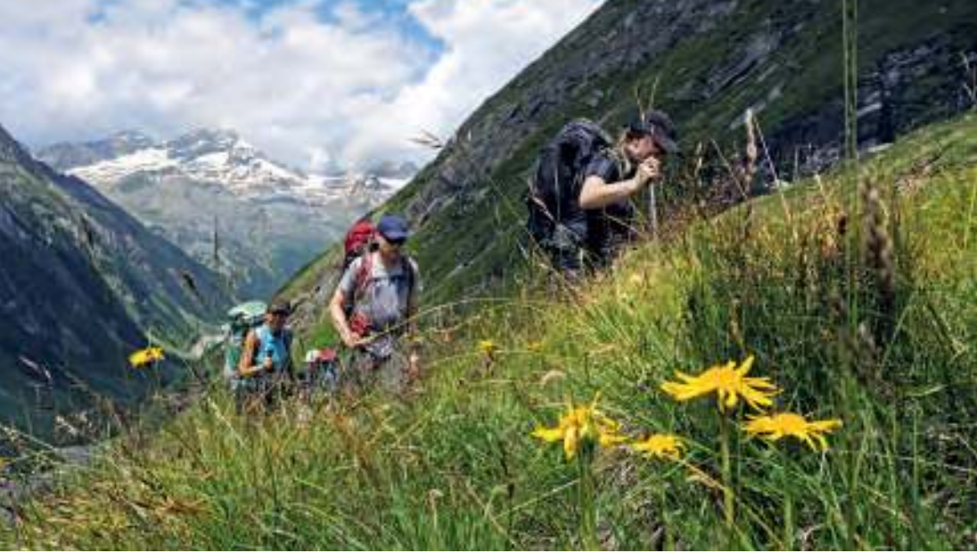
Aufstieg zum Furtschaglhaus des DAV

Natur mit der Einhaltung einfacher Regeln viel zurückgeben: