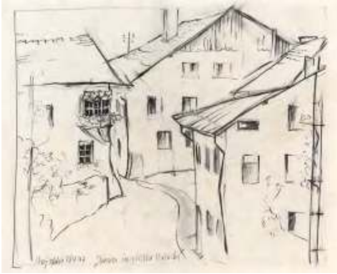
Häuser im geliebten Perfuchs, 1977, Bleistiftzeichnung auf Papier, 29 x 37 cm (Passepartoutausschnitt), Privatbesitz

Da der Vater untertags „im Holz“ ist und auch die Oma kränklich, wird das Mädchen nun zur Kostgängerin bei Nachbarsfamilien. Eine Arztfamilie will das Mädchen sogar bei sich zuhause aufnehmen. Zum ersten Mal sieht es ein Klavier, einen schönen alten Flügel. Die Arztfrau spielt dem Mädchen Schubert vor, das Mädchen ist verzaubert. Aber bleiben kann das Mädchen nicht, denn es hat Sehnsucht nach dem Vater und Angst um ihn. Dann will die Verwandtschaft das Mädchen ins Kinderdorf in Imst geben. Die Häuser findet das Mädchen wunderschön, alles ist geordnet und sauber, auch einen Spielplatz gibt es, die Kinderdorfmutter ist lieb, aber das Mädchen hält es trotzdem nicht aus, es läuft davon, heim zum Vater.