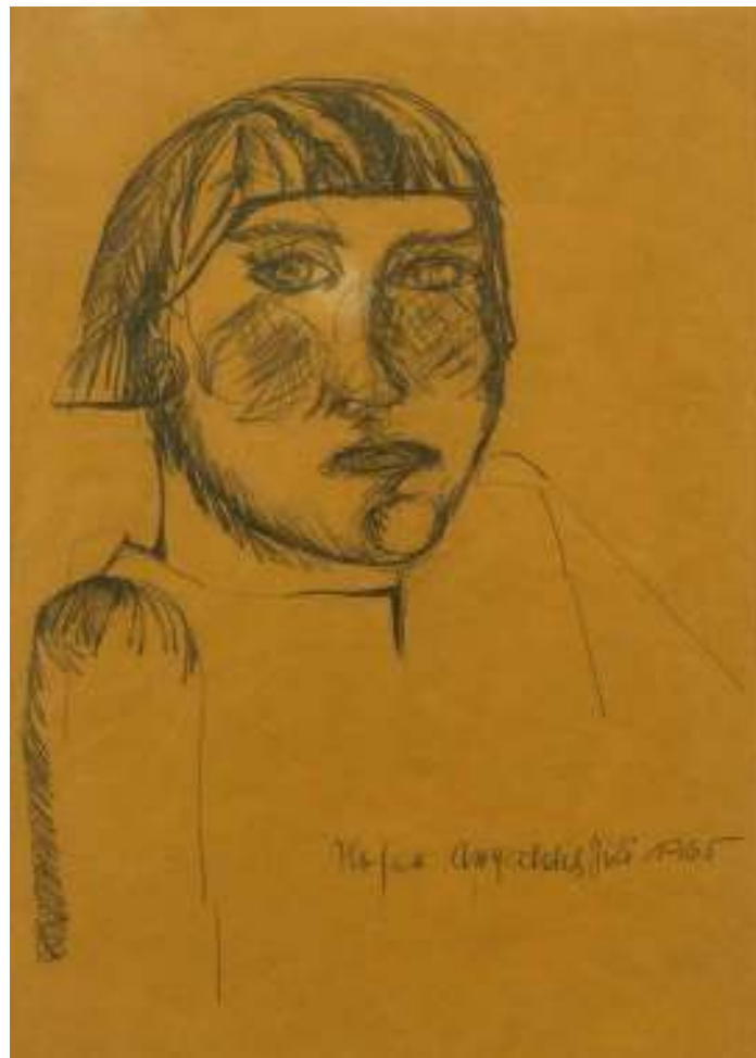
Selbstbildnis, 1965, Bleistift auf Papier, 29,8 x 20,8 cm (Passepartoutausschnitt), Privatbesitz