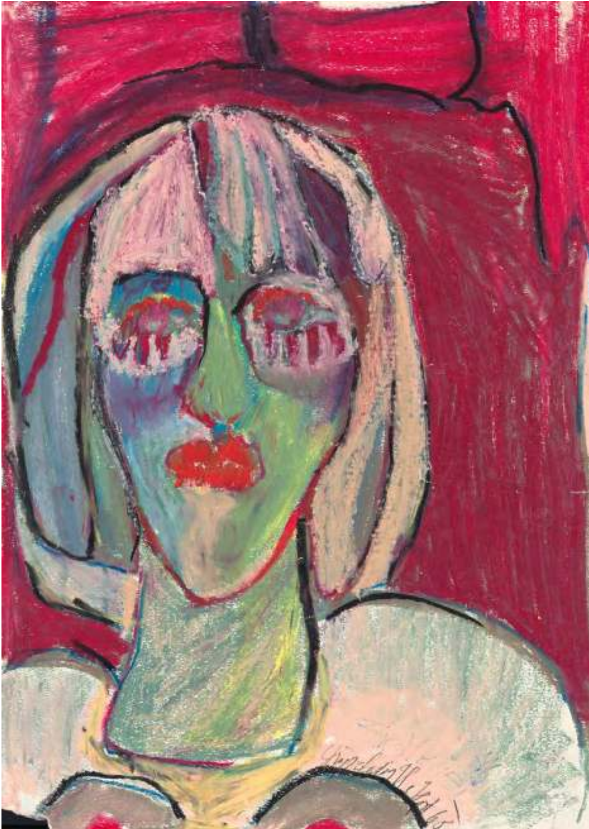
Selbstporträt, 1968, Tempera und Ölkreide auf Papier, 41,6 x 29,7 cm, Privatbesitz