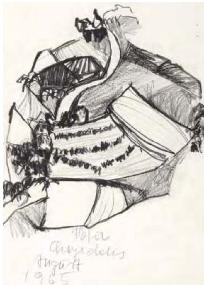
O. T., Bleistiftzeichnung auf Papier, 1965, 28,5 x 20,2 cm (Passepartoutausschnitt), Bezirksmuseumsverein Landeck

Später wird das Mädchen dieses Haus und seine Räume immer wieder malen. Und sie wird, obwohl sie als einziges Kind des Vaters übrig bleibt, obwohl sie die Erbin ist, das Haus an Verwandte verlieren.