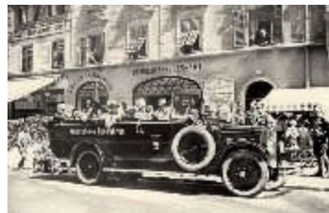
Eine neue Touristenattraktion seit 1914: Rundfahrt um das Kaisergebirge (Bild aus dem Jahr 1928)

Der Mauttarif, der auf Betreiben der Gemeinden des Sölllandes eingefordert wurde, erschien