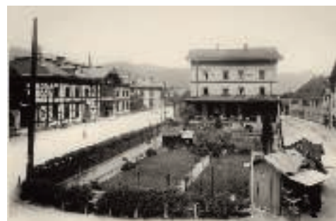
Der Kufsteiner Bahnhof um 1900

Erst als 1858 die Eisenbahnlinie Rosenheim–Innsbruck eröffnet wurde, änderte sich dies grund-