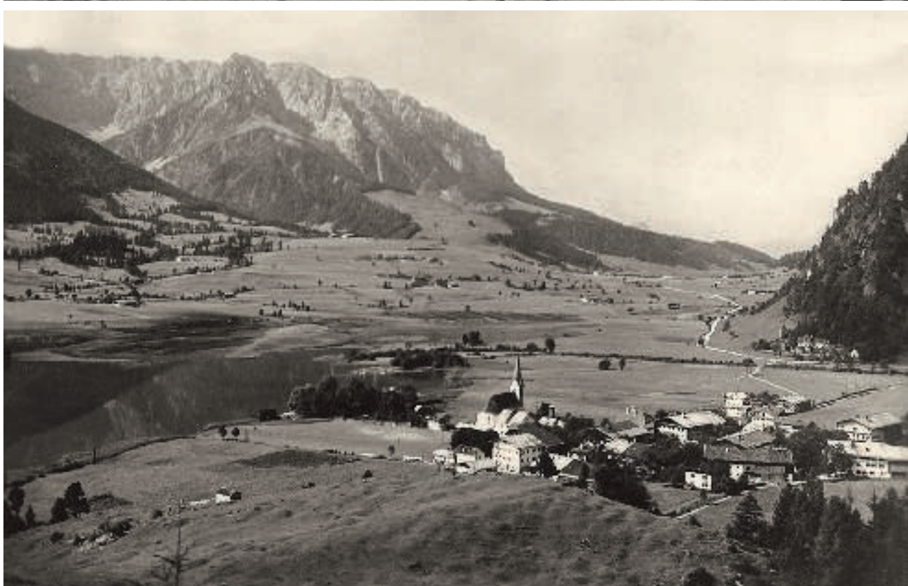
↑↑ Going um 1900 ↑ Walchsee um 1900