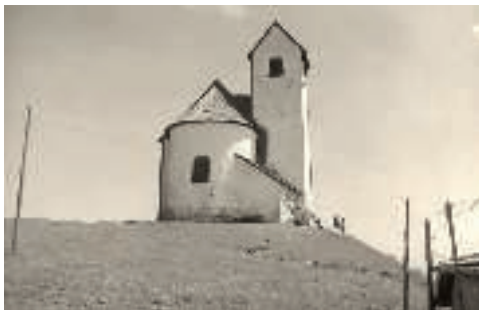
Die Hohe Salve mit der bekannten Wallfahrtskapelle

Bourdieu das Sammeln von sozialem Prestige durch bestimmte Aktivitäten bezeichnete. Man gehörte danach zum erlesenen Kreis der Bergsteiger, genoss die gleichen Aus- und Einsichten, teilte gemeinsame Erfahrungen und konnte mehr oder minder Ähnliches erzählen. Wer auf der Salve oder einem ähnlichen Aussichtsberg war, erfuhr innerhalb seiner sozialen Gruppe aus Bürgern und Adelligen, die sich immer mehr für die „schöne Aussicht“ in die „erhabene und reizende“ Bergwelt interessierte, soziale Anerkennung. Gepilgert wurde nun nicht mehr in erster Linie zur Wallfahrtskirche, sondern zum Ort, an dem bereits Marie Louise von Österreich war. Gepilgert wurde nicht mehr zum heiligen Johannes, sondern zur schönen Aussicht. Bereits in Vierthalers Bericht und auch in jenem über Marie Louises Besteigung erscheint die Wallfahrt also zweitrangig. Im Zentrum stehen der Panoramablick auf die umliegenden Gebirgsketten, der detaillierte Schilderung erfährt, sowie die geografisch akribischen Versuche, Berge und Gebirgszüge zu benennen und einzuordnen. Zugleich wird vermittelt und geschult, wie die Gebirgsmassen wahrzunehmen sind: als ästhetischer Genuss.