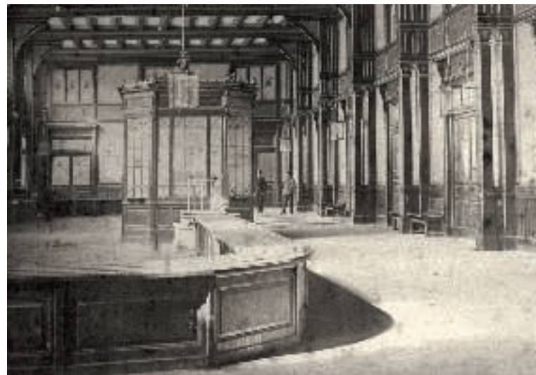
Die Bahnhofshalle in Kufstein um 1880

Als sich der touristische und damit auch wirtschaftliche Erfolg in Kitzbühel und anderen Orten mit Bahnanschluss allmählich einstellte, blickten auch einige Söllländer mit Wehmut auf die verpasste Chance. 31 Das Argument der kürzesten Wegstrecke war immer noch gültig und so tauchten bald wieder Pläne einer direkten Bahnlinie zwischen Salzburg