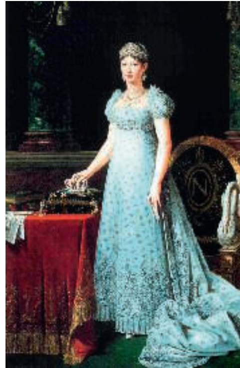
Marie Louise von Österreich, verheiratet mit Napoleon

Solche Unternehmungen können wie Wallfahrten und Pilgerreisen als Vorform des modernen Tourismus bezeichnet werden. In einer Zeit vor moderner Sozialgesetzgebung und organisierter Arbeitswelt, als der Begriff „Urlaub“ noch unbekannt war, wurden diese Reisen und Ausflüge zur Erholung und zum „Ausbrechen aus der dörflichen Sozialkontrolle“ 3 genutzt. Noch im 18. Jahrhundert brachten die Menschen ihre Freizeit zu einem Gutteil für kirchliche Verpflichtungen auf. Standen auf dem ersten Blick religiöse Motive im Vordergrund, so finden sich auf den zweiten Blick Variationen des Fluchtmotivs: Man wollte dem Alltag entkommen, eine Arbeitspause einlegen, Abwechslung. Dementsprechend ist in einer Beschreibung zur Hohen Salve von 1841 zu lesen: „Mit Vorliebe wallen viele Fromme nach jenem erhabenen Punkte, wo es leichter wird, der Niederung und des Erdenstaubes zu vergessen, und das Gemüth himmelwärts zu erheben.“ 4 Wie aus zahlreichen zeitgenössischen Klagen hervorgeht, waren Wallfahrten aber zugleich auch Vergnügungsausflüge, bei denen etwa der Besuch von Wirtshäusern eine zentrale Rolle spielte. Auch auf der Hohen Salve gab es eine Art Wirtshaus: das Haus des „Salvenhüters“, der dort oben als Mesner seinen Dienst versah und Wallfahrende bewirtete.