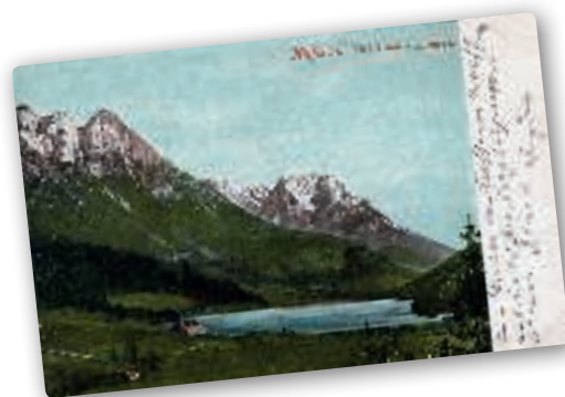
Grüße vom Hintersteinersee , 1908

dort erzählte. Dabei interessierte er sich vor allem für die „einfachen“ Leute und deren Leben. Auf seinem winterlichen Weg zum Walchsee traf er einmal auf zwei besondere Charaktere: „Endlich aber holte mich doch ein Paar ein, dessen Aussehen etwas versprach. Es waren zwei Männer in den schlechtesten Kleidern. Beide hatten ihre Ohren mit Taschentüchern umwickelt und schritten stumm nebeneinander her, wie wenn sie fürchteten, die Schutzgeister ihres Branntweinführstückes möchten ihnen durch den geöffneten Mund entfliehen. [...] Der eine war Hadern- oder Lumpensammler. Aus seinem Munde erfuhr ich, daß es für sein Geschäft keine günstigere Zeit gibt als eben diesen germanischen Eismonat. Die Sommer- und Herbstarbeit nützt die Gewänder der Bauern ab, welche von diesen so lange getragen werden, bis sie durch die Kleidergeschenke, welche um den Jahreswechsel herum stattfinden, völlig überflüssig werden. Indessen schien selbst diese glänzendste Periode seines Geschäftsbetriebes den Hadernsammler nicht davor zu schützen, daß er selbst in Lumpen gehen mußte.“ 21 Sein Kompagnon war wandernder