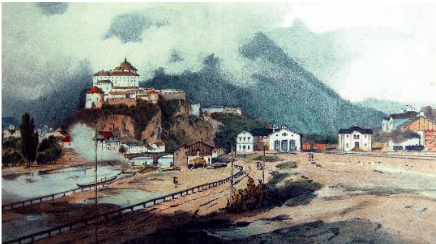
Kufstein und der neue Bahnhof (um 1860). Links erkennt man noch die Überbleibsel der einst bedeutenden Innschiffahrt.

verkehrsachse von Deutschland nach Italien – zumindest nicht für den Personenverkehr. Das ist heute angesichts der zur Selbstverständlichkeit gewordenen Inntal- und Brennerautobahn nur mehr schwer nachvollziehbar. Schon die Römer bevorzugten den kürzeren Weg von Innsbruck nach Garmisch-Partenkirchen, um in die Hauptstadt der Provinz Raetien, Augsburg, zu gelangen; auch die spätere Via Imperii verlief auf dieser Route nach Nürnberg. Und noch Johann Wolfgang von Goethe wählte für seine Italienreise im Jahr 1786 den Weg von München über Mittenwald und den Zirler Berg nach Innsbruck, denn dies war der kürzeste und mit der Kutsche auch der schnellste Weg. Viele hauptsächlich adelige Italienreisende, die auf ihrer obligaten „Grand Tour“ antike Stätten aufsuchten, folgten seinem Vorbild. Etliche Reisebeschreibungen trugen diesem Umstand Rechnung, weshalb das Tiroler Unterland darin meist nicht vorkam und lange eine touristisch wenig beachtete Randzone blieb.