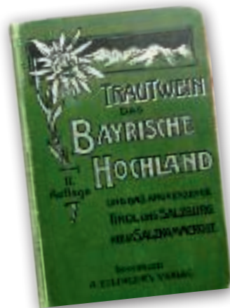
Der erste detaillierte Reise- und Wanderführer von Theodor Trautwein für die Bayerischen und Tiroler Alpen, 1865

Noë interessierte sich jedoch nicht nur für die kontrastreiche Landschaft, die er mit naturalistischer Detailgetreue sprachlich reproduziert. Seine wirkungsvollen Stimmungsbilder entwarf er auch, indem er von den Begegnungen mit den Menschen