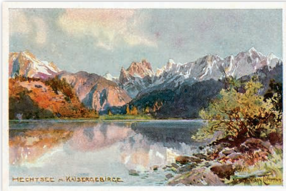
Postkartenmotiv des Malers Edward Harrison Compton , 1903

dort erzählte. Dabei interessierte er sich vor allem für die „einfachen“ Leute und deren Leben. Auf seinem winterlichen Weg zum Walchsee traf er einmal auf zwei besondere Charaktere: „Endlich aber holte mich doch ein Paar ein, dessen Aussehen etwas versprach. Es waren zwei Männer in den schlechtesten Kleidern. Beide hatten ihre Ohren mit Taschentüchern umwickelt und schritten stumm nebeneinander her, wie wenn sie fürchteten, die Schutzgeister ihres Branntweinführstückes möchten ihnen durch den geöffneten Mund entfliehen. [...] Der eine war Hadern- oder Lumpensammler. Aus seinem Munde erfuhr ich, daß es für sein Geschäft keine günstigere Zeit gibt als eben diesen germanischen Eismonat. Die Sommer- und Herbstarbeit nützt die Gewänder der Bauern ab, welche von diesen so lange getragen werden, bis sie durch die Kleidergeschenke, welche um den Jahreswechsel herum stattfinden, völlig überflüssig werden. Indessen schien selbst diese glänzendste Periode seines Geschäftsbetriebes den Hadernsammler nicht davor zu schützen, daß er selbst in Lumpen gehen mußte.“ 21 Sein Kompagnon war wandernder