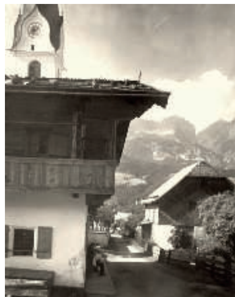
Ellmau um 1890

und Wörgl auf. Sie sollte über das „kleine deutsche Eck“ führen, also entlang der alten Reichsstraße über Lofer und Bad Reichenhall, und die Strecke von Wien nach Innsbruck um 100 km sowie die Fahrzeit der Personenzüge um 3 bis 4 Stunden verkürzen.