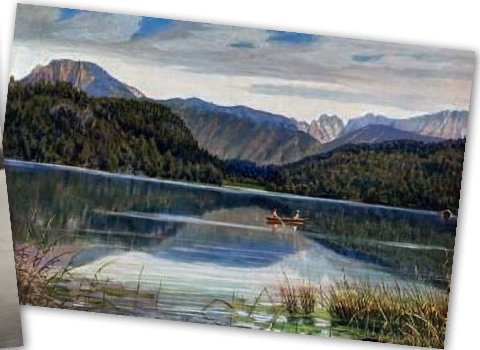
Postkarte vom Hechtsee , 1912 (Verlag Lippott und Karg)