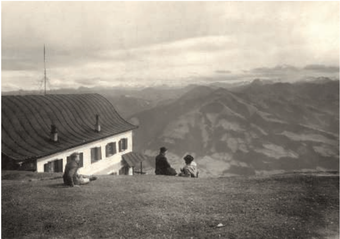
Touristen genießen die Aussicht von der Hohen Salve in den 1950er-Jahren.