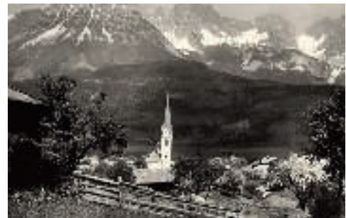
Ellmau gegen den Wilden Kaiser (um 1900)

Das Projekt wurde nie realisiert. Zu groß waren die Differenzen der verschiedenen Interessenten. Die Kössener glaubten, dass die Kufsteiner Unternehmer, die das Projekt forcierten, allen voran der