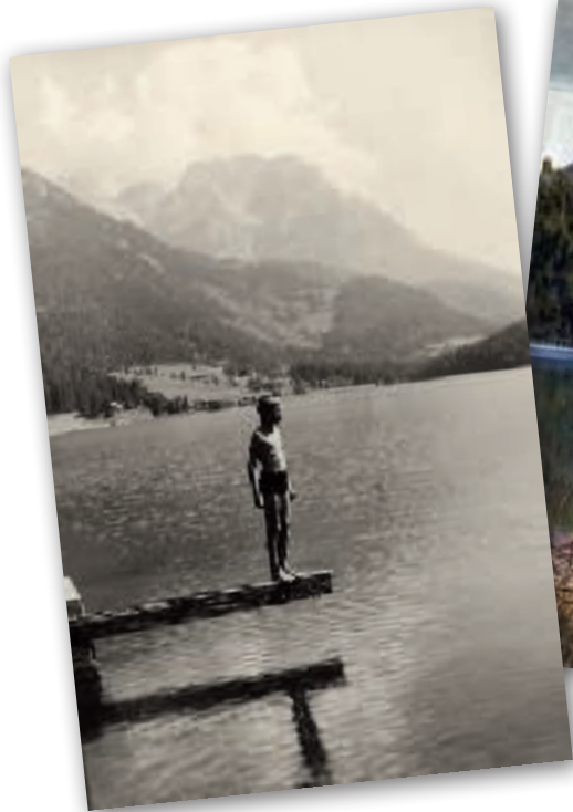
Der Hintersteinersee als Postkartenmotiv in den 1950er Jahren.