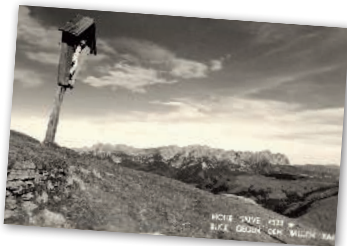
Postkarte von der Hohen Salve aus den 1960er Jahren mit Blick gegen den Wilden Kaiser

bildete es die einzige Fortbewegungsmöglichkeit – man denke beispielsweise an Wanderhändler und Handwerker auf der Walz. Aber Wandern als Freizeitvergnügen, als freiwillige Betätigung ohne ökonomische Notwendigkeit, ohne religiöse Absichten, nur um des Wanderns willen – das war von einzelnen Ausnahmen abgesehen relativ neu. Damit ist nicht gesagt, dass vorher niemand Vergnügen beim Wandern empfunden hätte. Doch häuften sich Ende des 18. und am Beginn des 19. Jahrhunderts die schriftlichen Dokumentationen dieser neuen Wanderlust, die ein großes und in dieser Form noch nie dagewesenes Ausmaß erreichte.