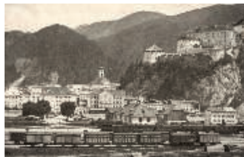
Eine frühe Aufnahme von Kufstein mit dem Bahnhof