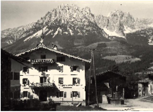
Ellmau um 1900 mit dem Gasthof Lobewein und dem Dorfbrunnen, der ursprünglich in Kufstein errichtet worden war.