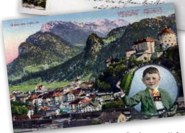
↑↑ Postkarte aus Kufstein (1898) mit der beliebten Teufelskanzel (links unten) ↑ Postkarte aus Kufstein , abgeschickt im Jahr 1918

einnahm und seine Reisen gewissermaßen auch als Flucht vor den bürgerlichen und zivilisatorischen Zwängen verstanden werden können, verklärte er das Leben und die sozialen Verhältnisse in den Alpen nicht unkritisch romantisierend. Seine Sittengemälde und Landschaftsstudien trugen erheblich dazu bei, dass sich Walchsee als Sommerfrischeort am Kaisergebirge etablierte. Darüber hinaus waren vor allem die anderen Seen rund um Kufstein und ums Kaisergebirge, wie der Hechtsee, der Stimmersee oder der Hintersteiner See, beliebte Sommerfrischeattraktionen.