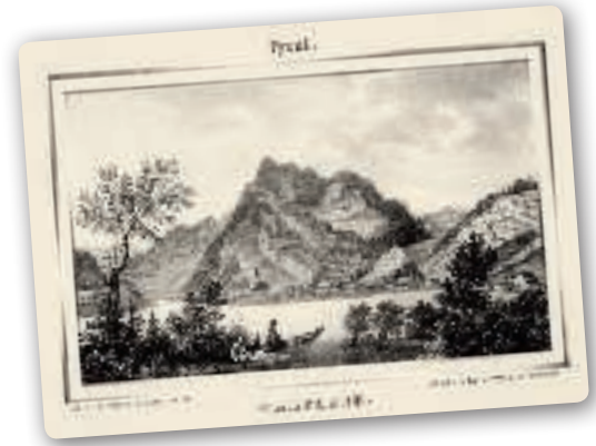
Frühe Tourismuswerbung: Lithografie von Stießberger nach G. Pezolt aus dem Buch „Die interessantesten Punkte von Salzburg, Tyrol und Salzkammergut“ (1839)

Von Oberaudorf aus unternahmen die feinen Herrschaften ausgedehnte Spaziergänge und Wan-