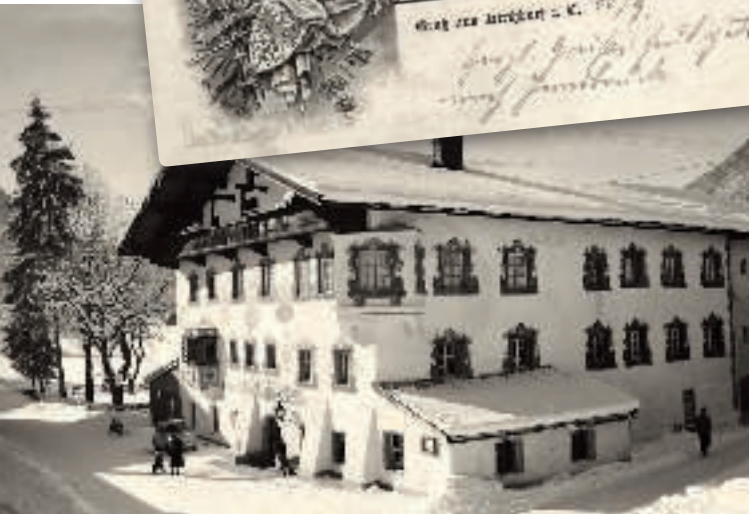
↑↑ Aus Kirchdorf stammte Schützenhauptmann Rupert Wintersteller , der als Held der napoleonischen Befreiungskriege gefeiert wurde. Postkarten um 1900 werben mit dieser Attraktion und weisen auf das ihm zu Ehren errichtete Denkmal als touristische Sehenswürdigkeit hin. ↑ Der Postwirt in Söll in den 1950er Jahren