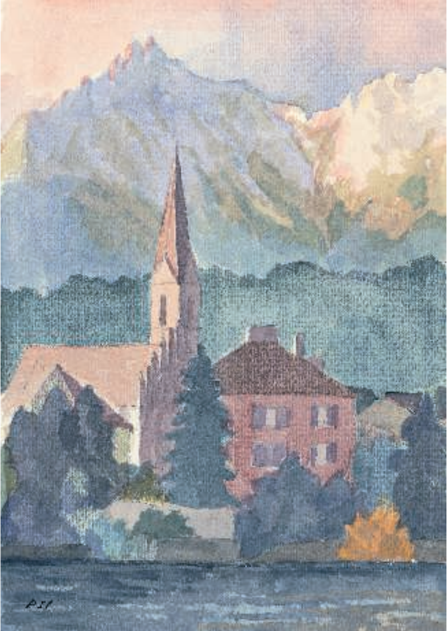
St. Nikolaus, Innsbruck