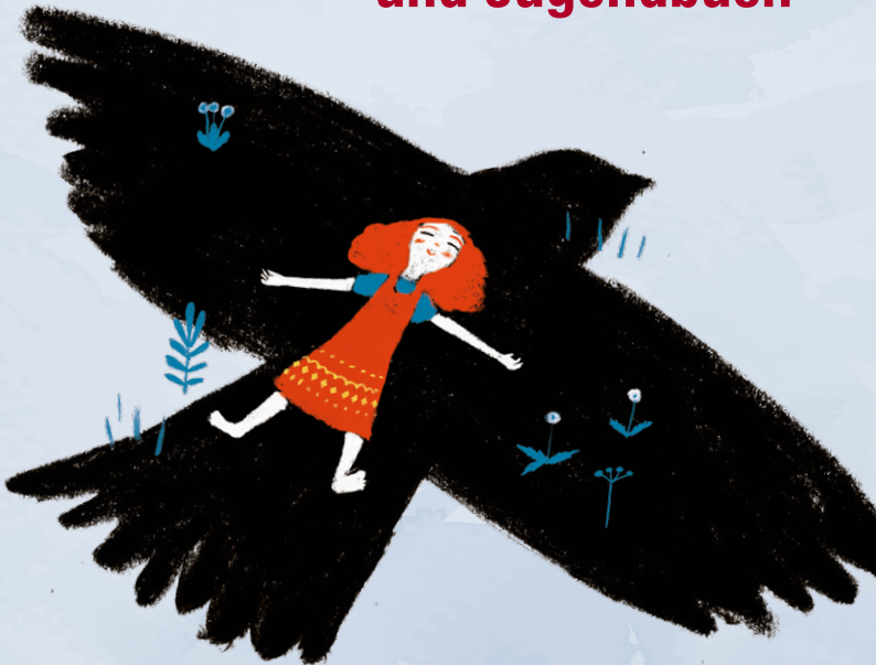
Illustration: Michael Roher, aus: Kathrin Wexberg (Hg.): „Immer mal wieder zum Himmel schauen – Gebete für Kinder“