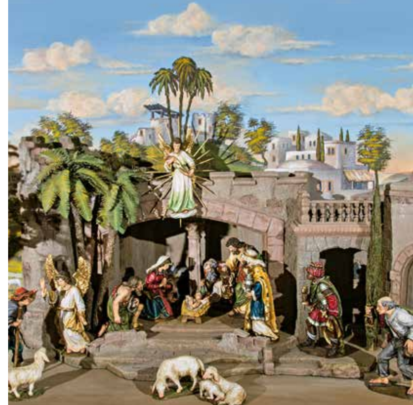
Krippe von Hans Knapp, aus: Gurschler/Knapp/Penz „Weihnachtskrippen bauen“